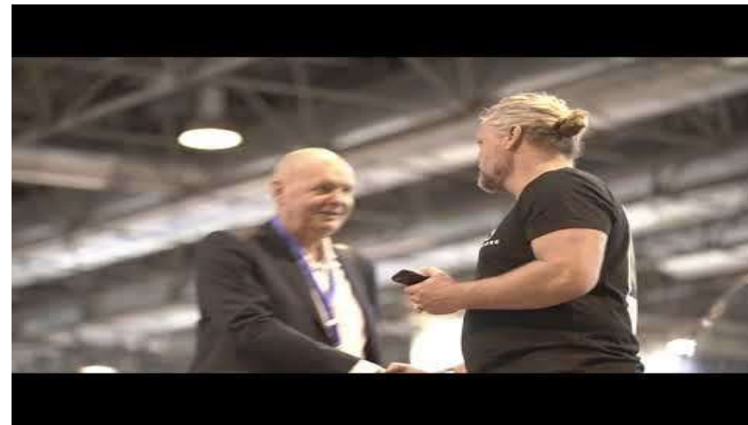
Wassersport und Umweltschutz - love your ocean https://youtu.be/rFjtSH2-D8